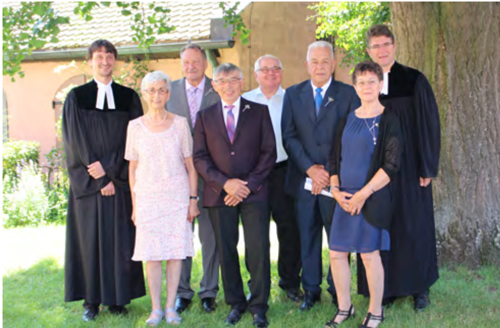
Diamantene Konfirmation (1959-2019)