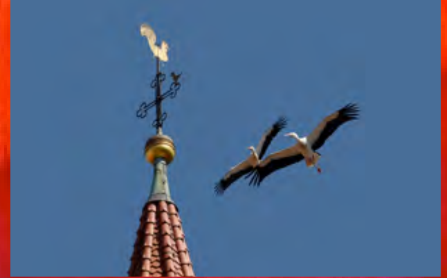
Störche sind unterwegs in Vach.