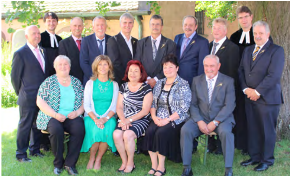
Goldene Konfirmation (1969-2019)