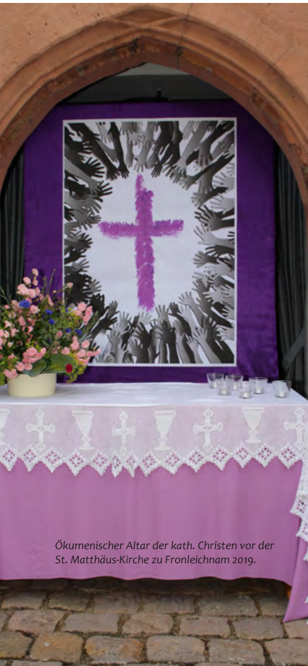
Ökumenischer Altar der kath. Christen vor der St. Matthäus-Kirche zu Fronleichnam 2019.