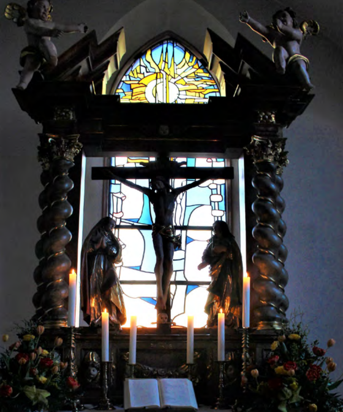
Kreuz und Auferstehung Jesu sind Höhepunkte im kirchlichen Jahreskreis und gehören zusammen. Seit Ostersonntag 2019 ist das Osterfenster im ganzen Format durch den Lichtaltar zu sehen.