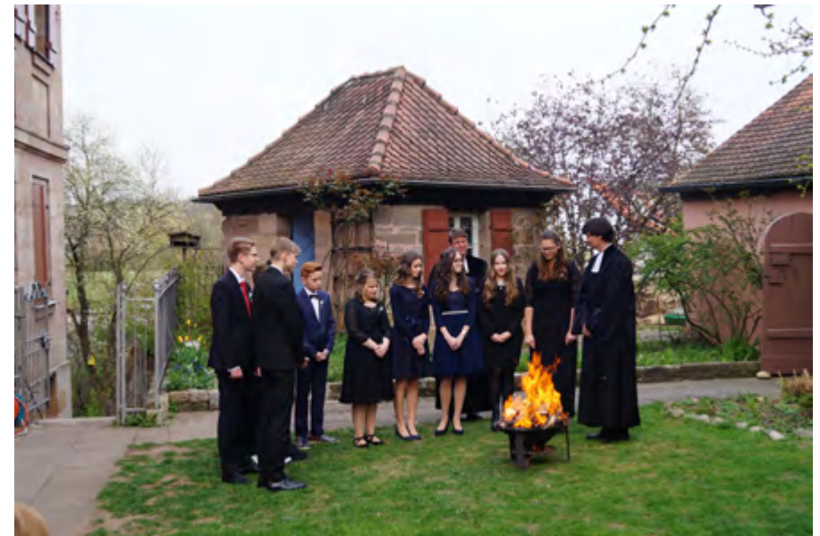
Verbrennen der Beichtbriefe.