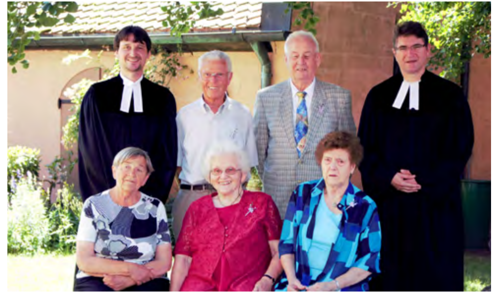
Eiserne Konfirmation (1954-2019)