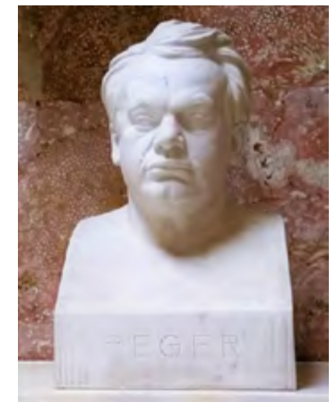
Max Reger (1873-1916)