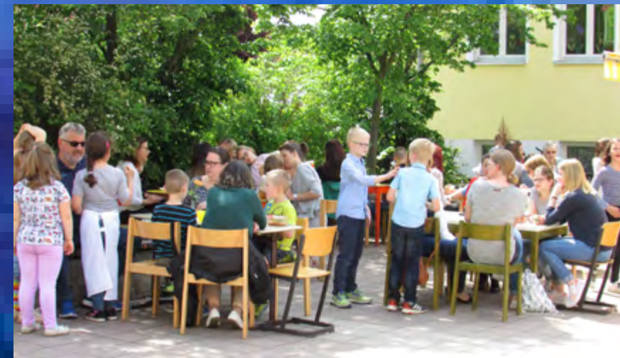
Das Bild zeigt unsere Eltern und Kinder beim Elternhortbistro (Mai 2019). Die Eltern wurden von den Kindern bedient. Es gab Kaffee und Kuchen, herzhaftes Gebäck und kühle Getränke.