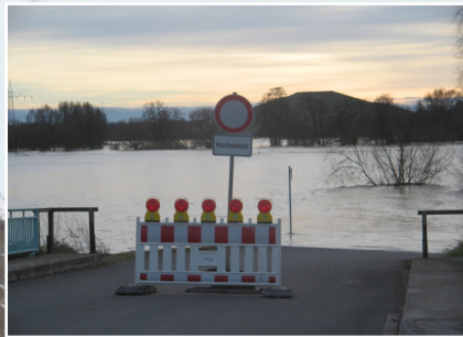
Im Regnitzgrund Land unter...