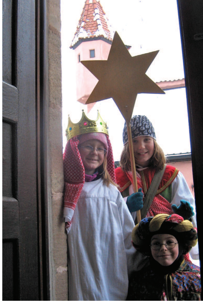
Kinder suchen neue Wege... Die Sternsinger unterwegs.