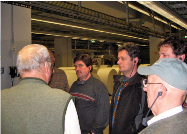
Werksbesichtigung bei den Nürnberger Nachrichten.