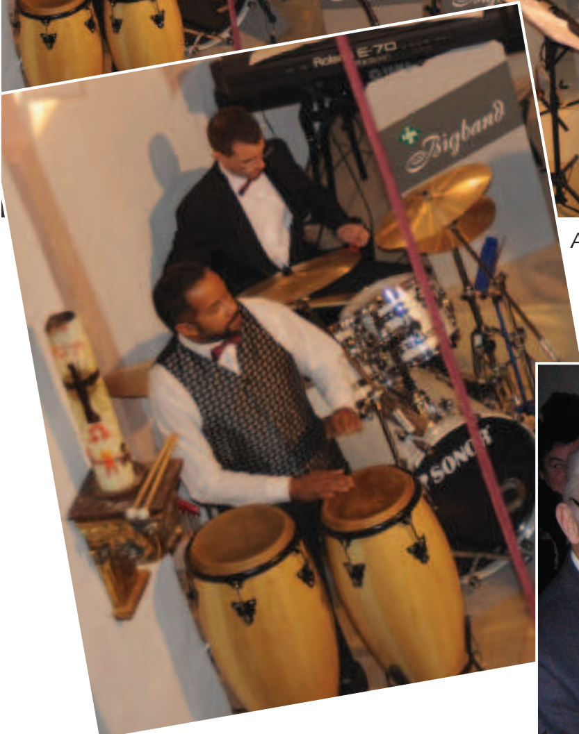
Adventskonzert der INA-Bigband .... so was gabs noch nie in Vach!