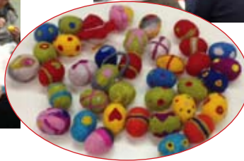
Große Konzentration beim Ostereier filzen.