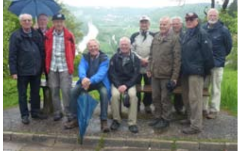
3-Tages-Wanderung auf dem Altmühltaler-Panoramaweg