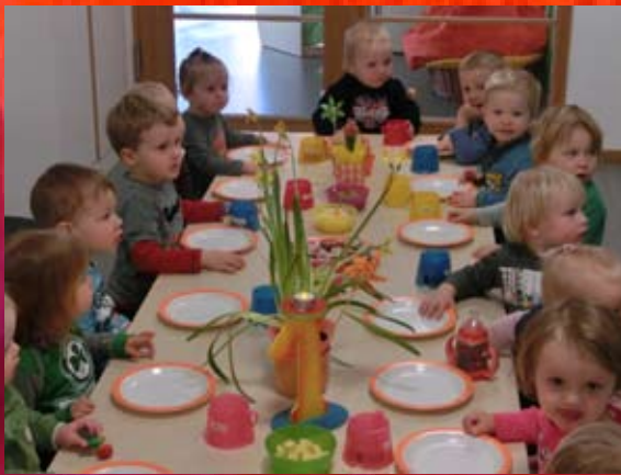
Auch Essen will gelernt sein...