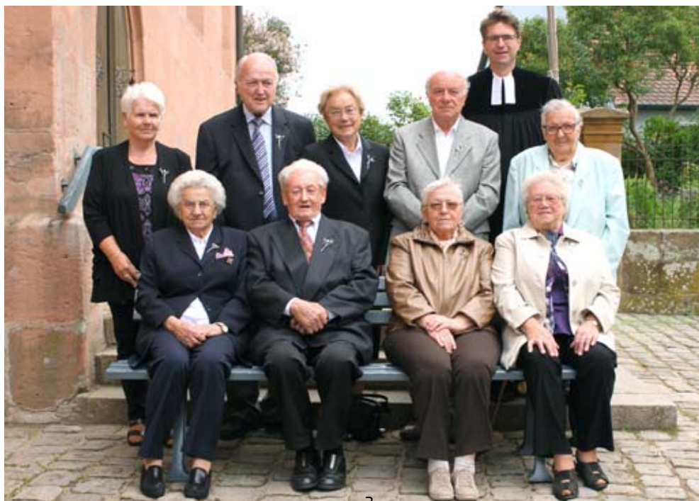
Eiserne (1950-2015) 3 u. Gnaden-Konfirmation (1945-2015)