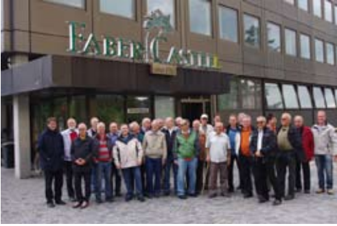
Werksbesichtigung in Stein