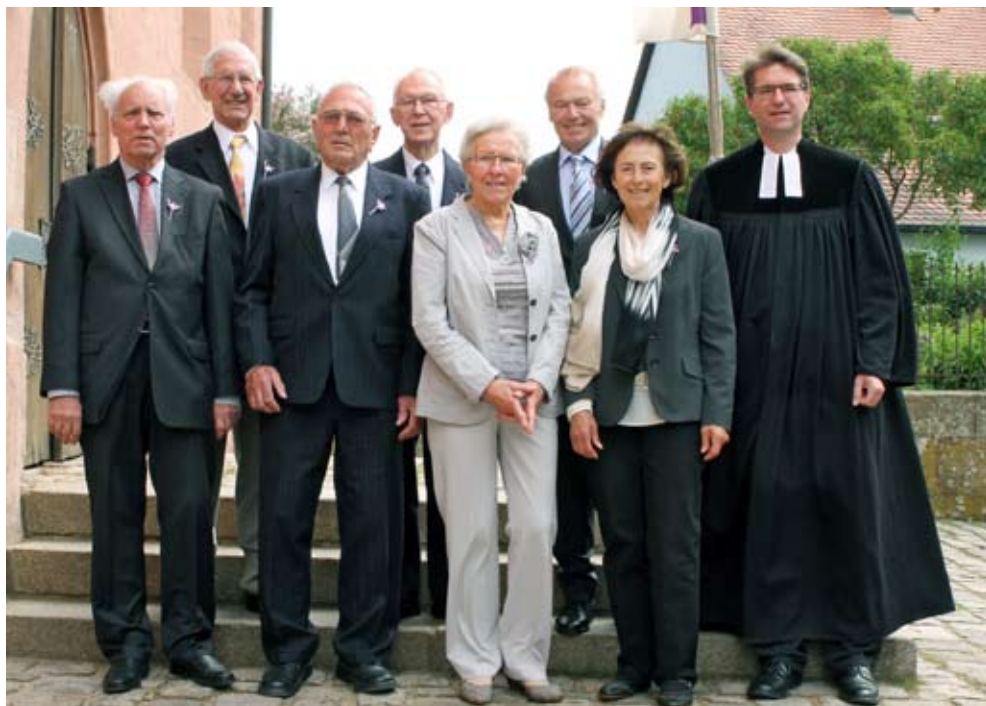
Diamantene Konfirmation (1955-2015)