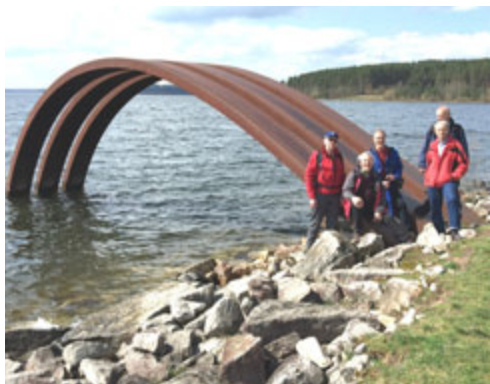
Von Pleinfeld zum Brombachspeicher