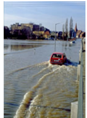
1981 Hochwasser in Vach