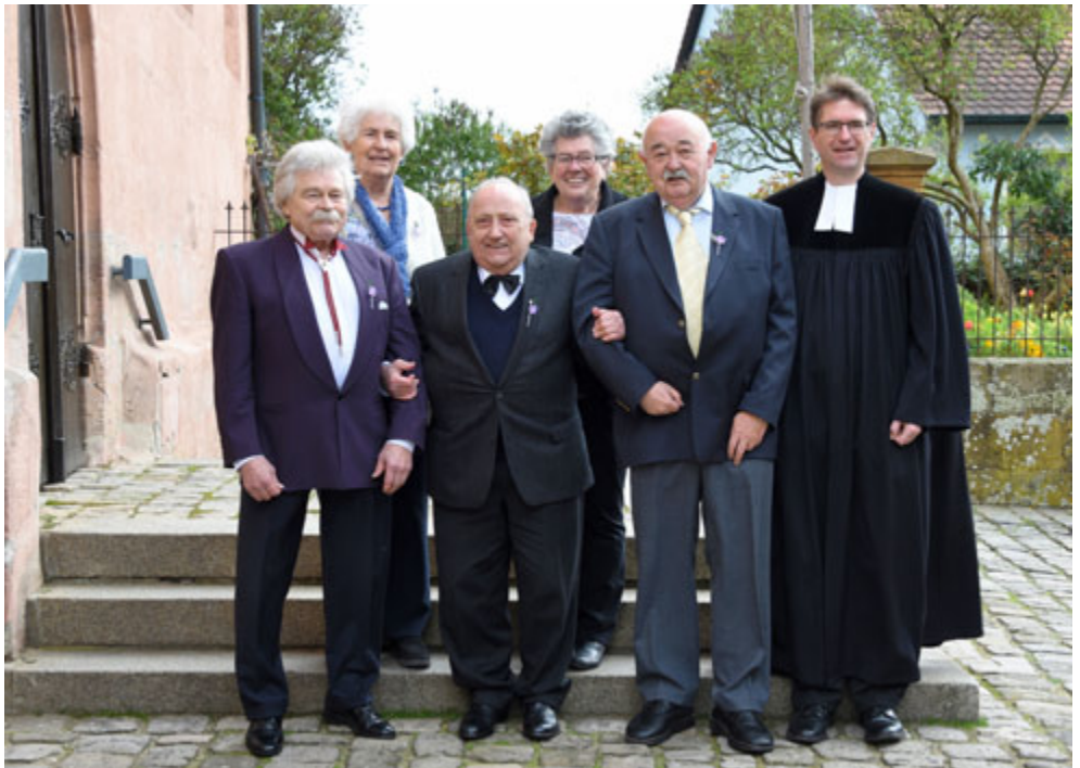
Eiserne Konfirmation (1951-2016)