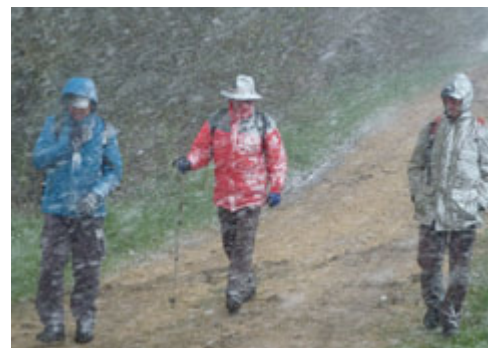
Wandern soll gesund sein!