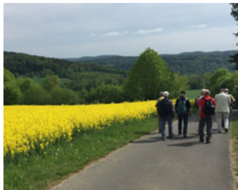
Im „Muggendorfer Gebirge“