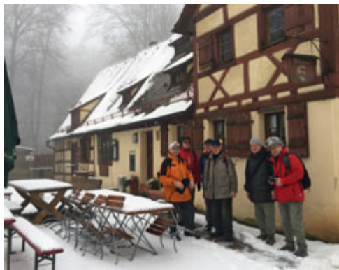
Rund um den Moritzberg