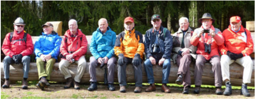
Männerrunde unterwegs: Mehrtageswanderung in der Schwäbischen Alb