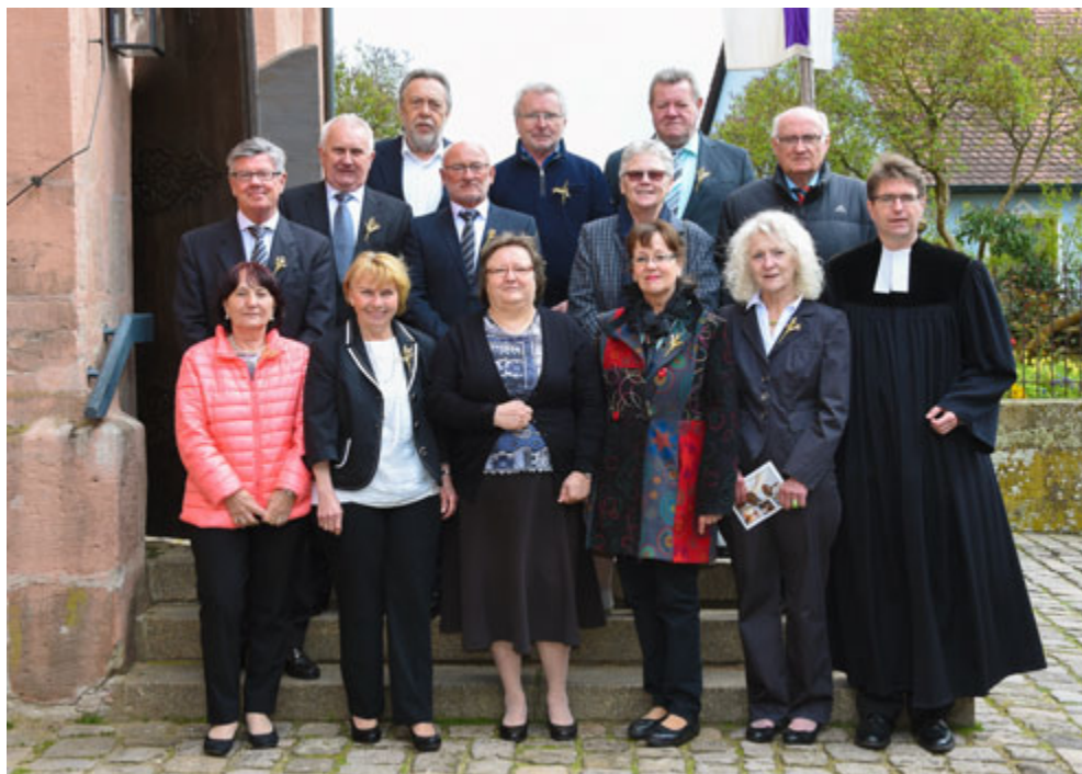
Wiedersehen macht Freude!