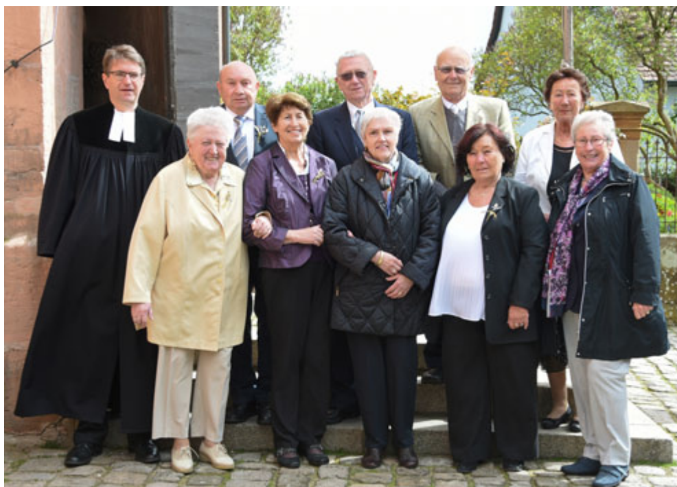
Diamantene Konfirmation (1956-2016)