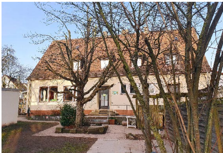
Der Kindergarten Am Vacher Markt

Im Jahr 2017 gelang es nach 12 Jahren Suche der Kirchengemeinde ein ausreichend großes Grundstück in bester Südlage am Vacher Schönblick für den Neubau eines 3-gruppigen Kindergartens zu erwerben. Damit setzte die Kirchengemeinde Maßstäbe, dass die Kindertageseinrichtungen ein wichtiger wie integrierter Bestandteil der Kirchengemeinde sind und macht deutlich, dass zu dem menschlichen Leben die religiöse Dimension (Woher