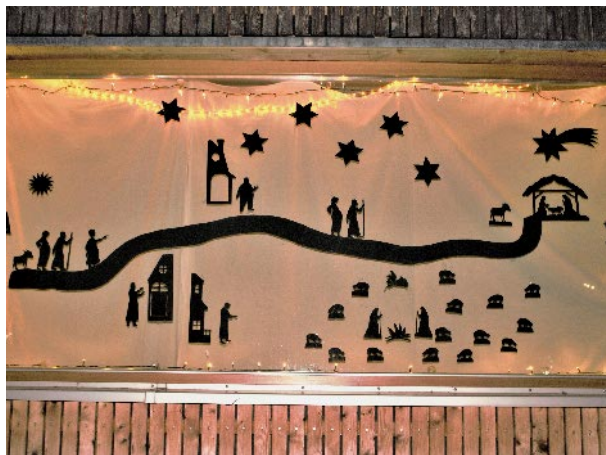
Beginn des Adventsfensterwegs in der Kinderkrippe

Es gab noch weitere interessante und vielfältige Angebote der Kirchengemeinde St. Matthäus Vach. Sei es die Weihnachtsgeschichte erzählt von den Hortkindern, die Gottesdienste, die mit Anmeldung in der Kirche stattgefunden haben, die Anregungen für Heilig Abend zu Hause und die Actionbound-Schnitzeljagd