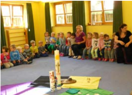
Passion und Ostern im Kindergarten