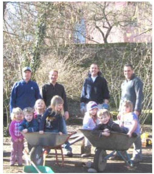
Hoch zu loben: Väter für Ihre Kinder im Einsatz für den Kindergarten