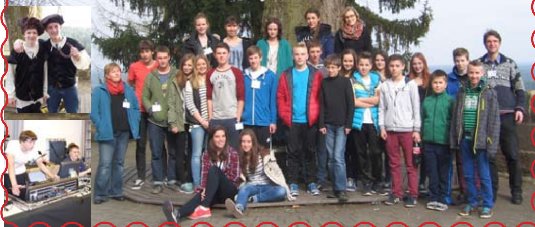
Junge Menschen auf dem Weg zu Ihrer Konfirmation