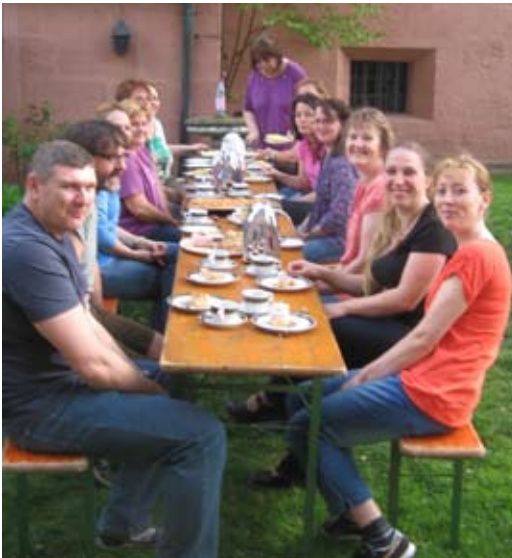
Fröhliche Kofirmandeneltern nach erfolgreichem Kirchenputz