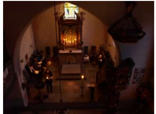
Ostern: vom Dunkel ins Licht!