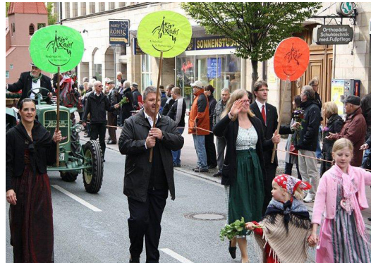
Unser Thema beim Erntedankfestzug in Fürth war: „St. Matthäus bleibt jung.“