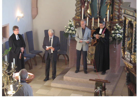
„Auch Männer dürfen schwach sein“. Das war das Thema des Männersonntags im Oktober 2011.