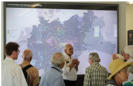
Gemeindeausflug nach Flossenbürg: Auf den Spuren von Dietrich Bonhoeffer.