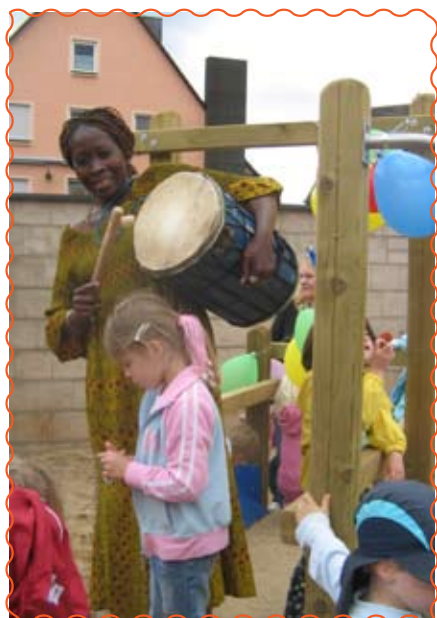
Kinder freuen sich über die neue Sandbaustelle. Die Weltmusik-Band Argile sorgte für prima Stimmung.