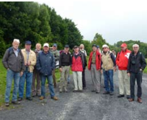
Männerrunde on tour in der Rhön