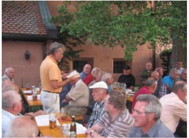
Literatur unterm Ginkgo-Baum