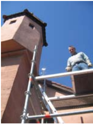
Reperatur an dem Scharwachturm der Kirche. Wir bitten um Ihre großzügige Unterstützung beim Kirchgeld 2012 (Siehe Brief mit Pflaster)