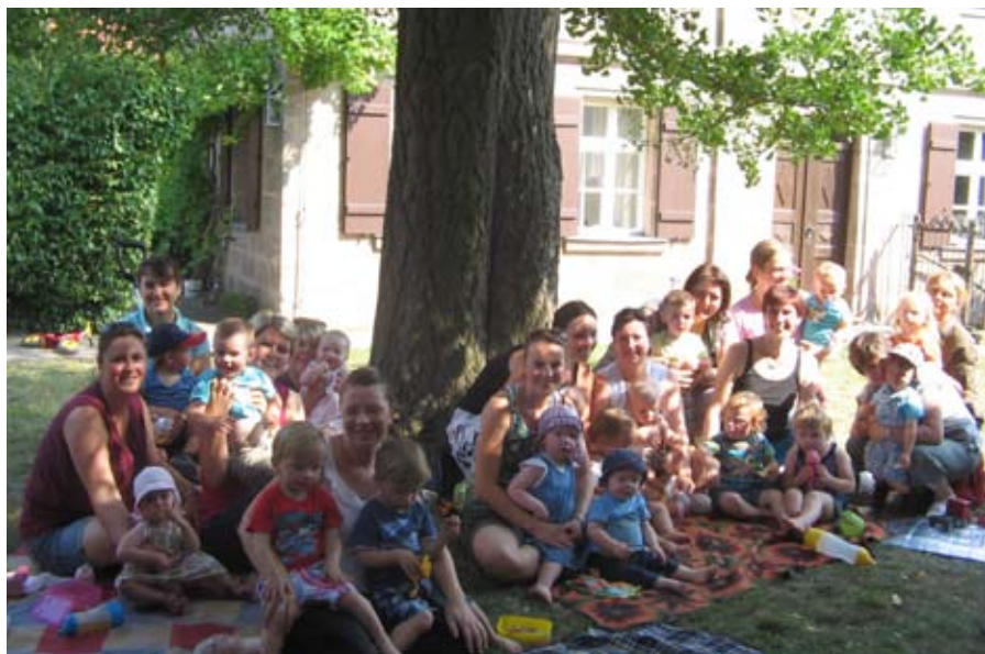
Die Eltern-Kind-Gruppe 2012 im Pfarrgarten unter'm Ginkgo-Baum