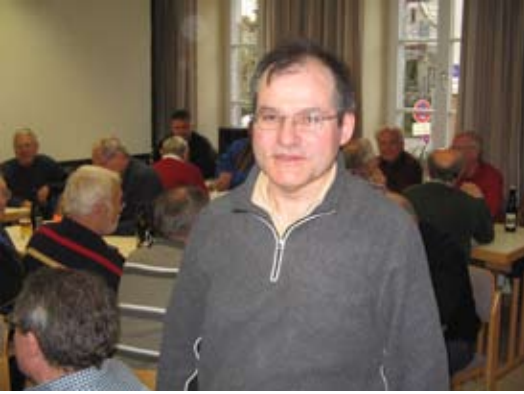
Männerrunde: 14000 km per bike zum Schwarzen Meer und zurück