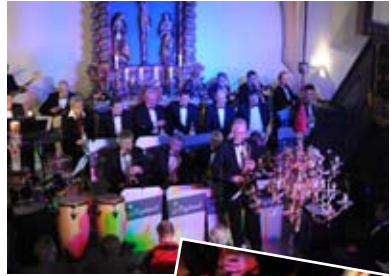
INA Bigband meets Kirche zugunsten des Horts St. Matthäus