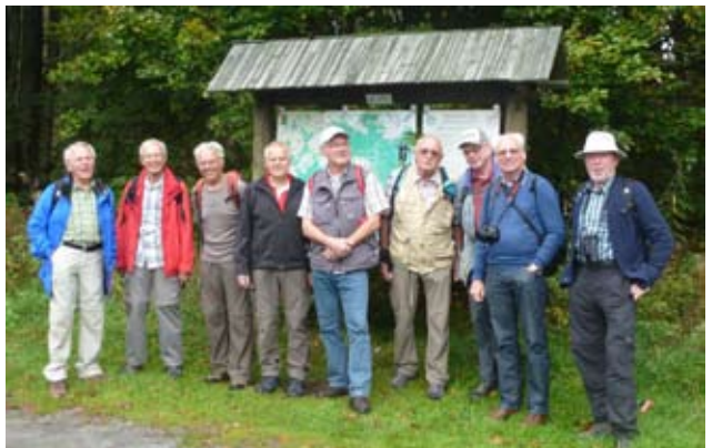
Männer unterwegs im Fichtelgebirge. Wir wollen fit bleiben.