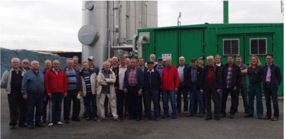
Wir wollten informiert sein über neue Energiegewinnung: Biogasanlage der infra