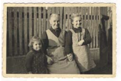
So war's damals...

Wir freuen uns auf Sie, Ihr Vachfrauen-Team