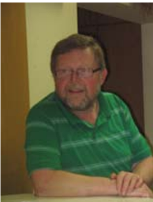
Ein Vacher erzählt von Früher.