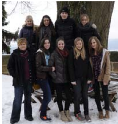
Konfi-Castle auf der Burg Wernfels mehr als ein Erlebnis. Highlight's in Bildern.