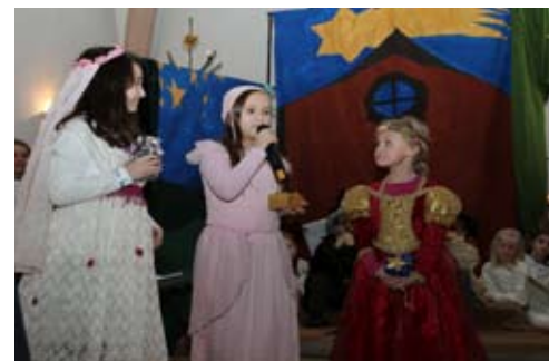
Rückblick: Unsere Kinder erzählten die Botschaft von Weihnachten. Einfach großartig!