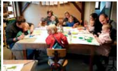
„Wer will fleißige Maler sehn...“