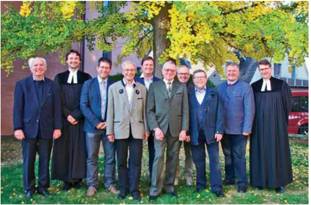
Männersonntag 2018 mit dem Thema: „Das Gute behaltet - beweglich bleiben“