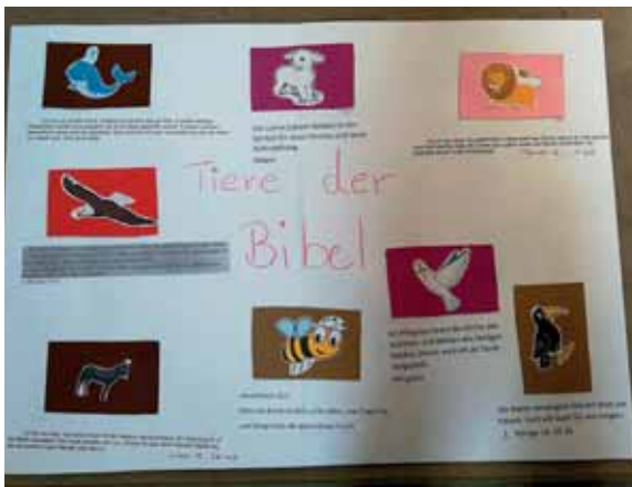
Wir lernten Tiere der Bibel kennen...