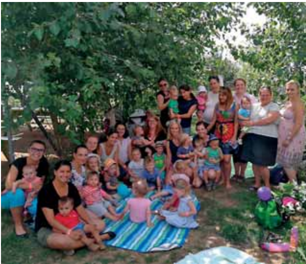
Ausflug nach Hüttendorf („Huckepack“)