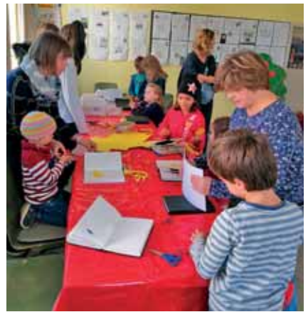
und befassten uns mit verschiedenen Bibeltexten