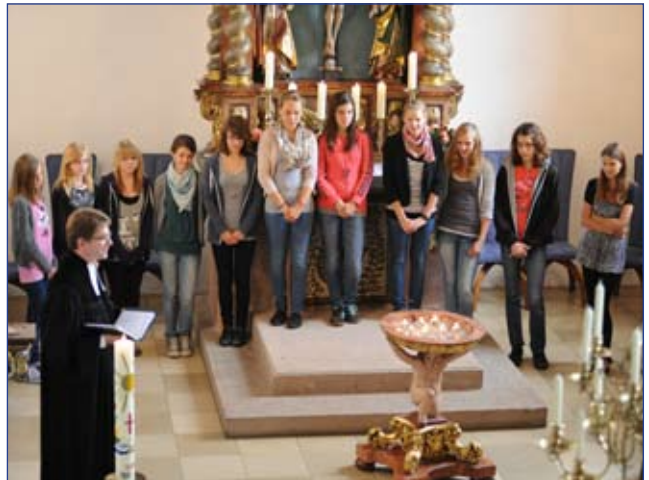
Die Konfirmandinnen und Konfirmanden 2012 bei ihrem Vorstellungsgottesdienst

Hurra, wir haben den 2. Platz erreicht (vor allem Dank unserer Damen) beim Endturnier des bayernweit ausgetragenen Konfirmanden-Cups auf dem Trainingsgelände des 1. FCN. Es stand unter dem Motto „Bunt ist cool - gegen Rassismus und Diskriminierung“