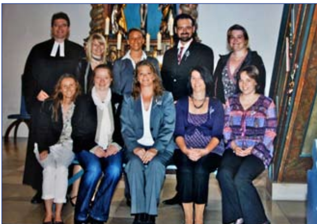
Silberne Konfirmation des Jahrgangs 1986