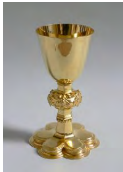
Abendmahlskelch von 1622 in St. Matthäus Vach (hinten)