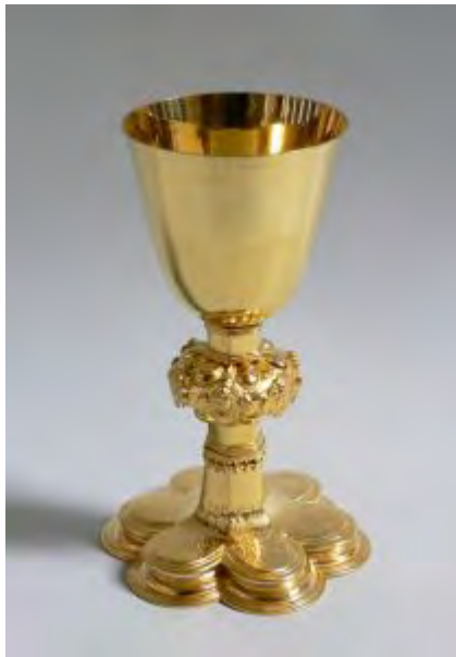
Abendmahlskelch von 1622 in St. Matthäus Vach (vorne)