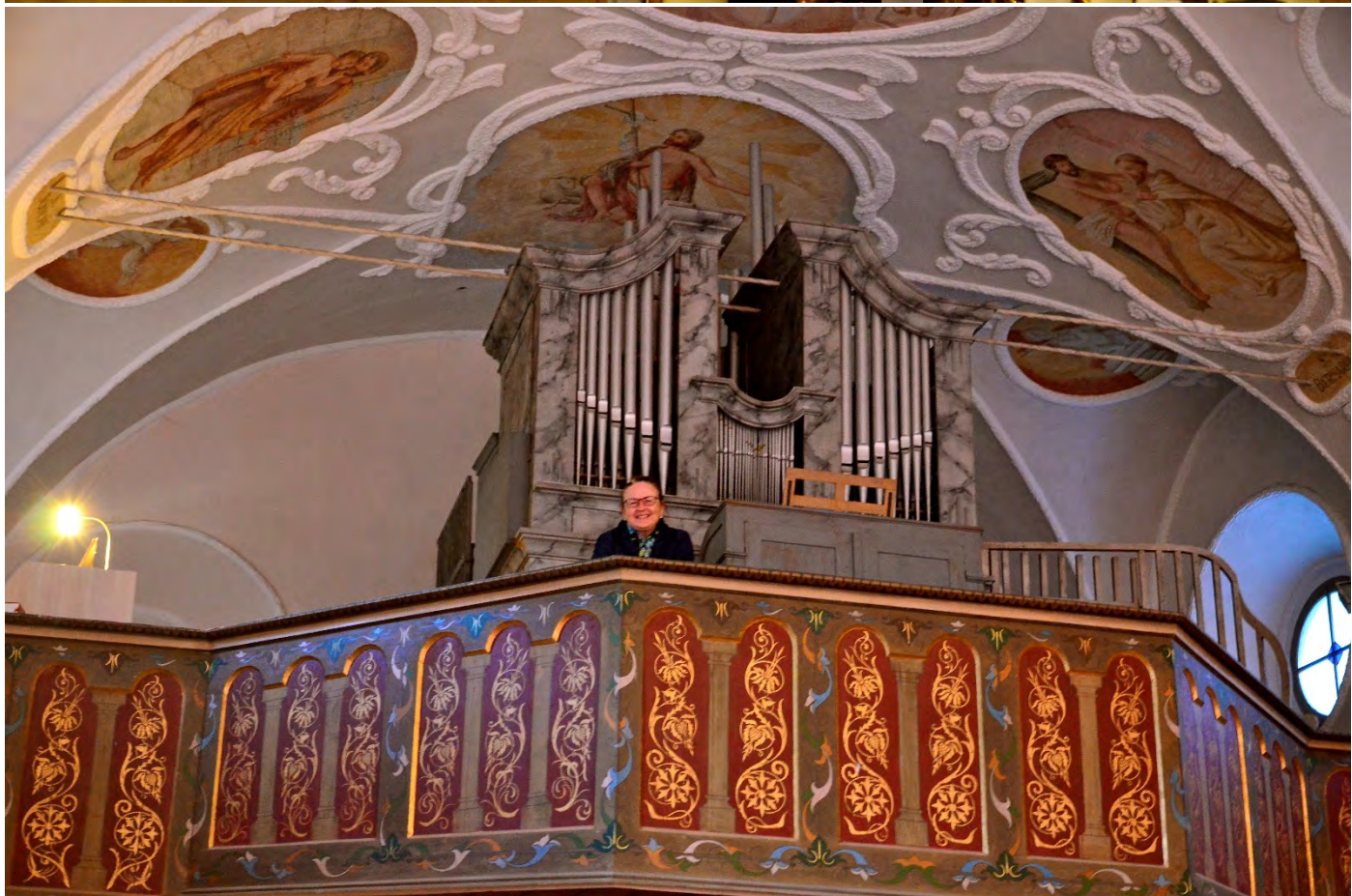
Der Abendmahlskelch kehrt für einen Abend zurück nach Klaus...