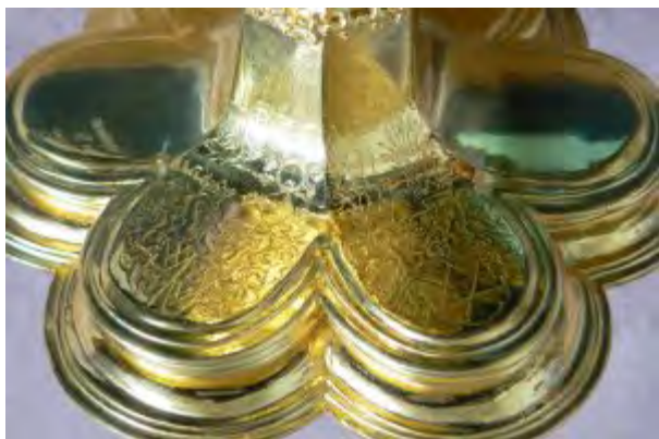
Abendmahlskelch von 1622 in St. Matthäus Vach (Wappen)