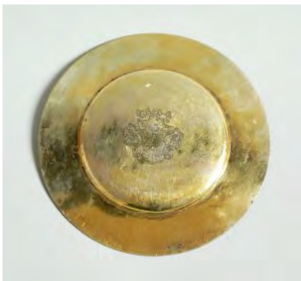
Patene von 1622 in St. Matthäus Vach