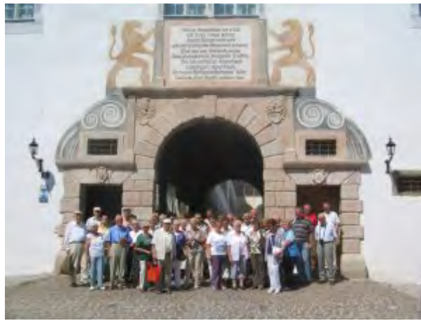
2010: Gruppenfoto mit 57 Teilnehmern bei der Gemeindefahrt zur öö. Landesausstellung

2010: Gemeindefahrt der Kirchengemeinde St. Matthäus Vach zur öö. Landesausstellung nach Parz