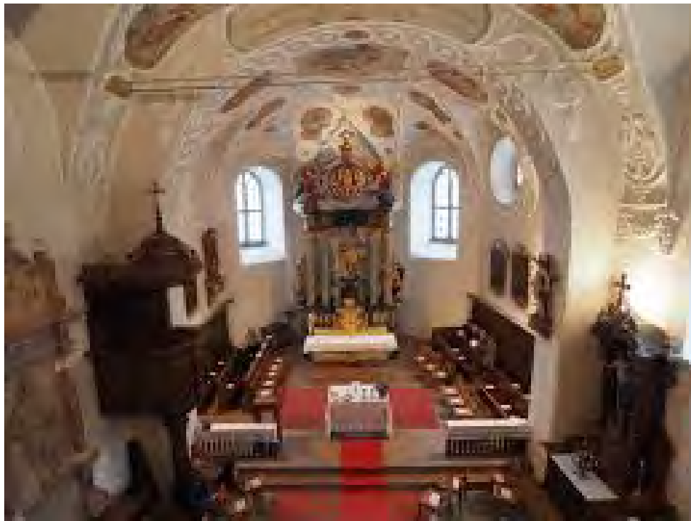
Die ehemals evangelische Bergkirche von Klaus im Inneren heute