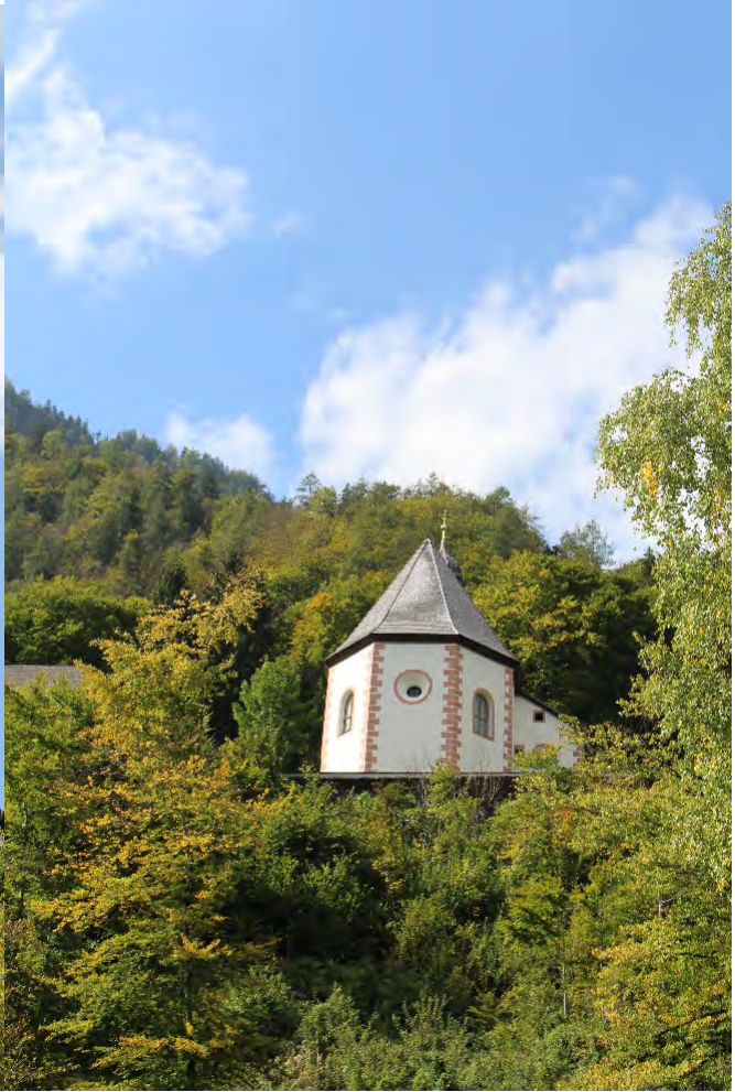
Burg, Schloß und die Kirche bilden ein einzigartiges Ensemble und bieten ein beeindruckenden Weitblick ins Steyrtal.