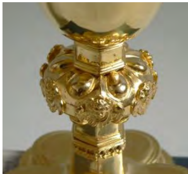
Abendmahlskelch der Kirchengemeinde St. Matthäus Vach:1622