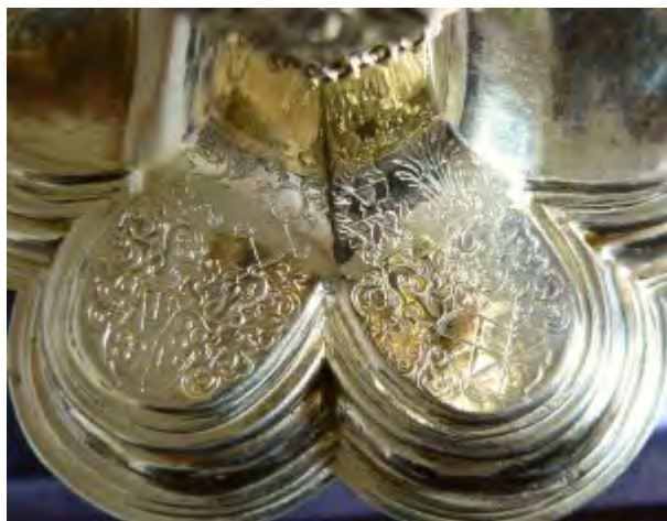
Abendmahlskelch der Kirchengemeinde St. Matthäus Vach