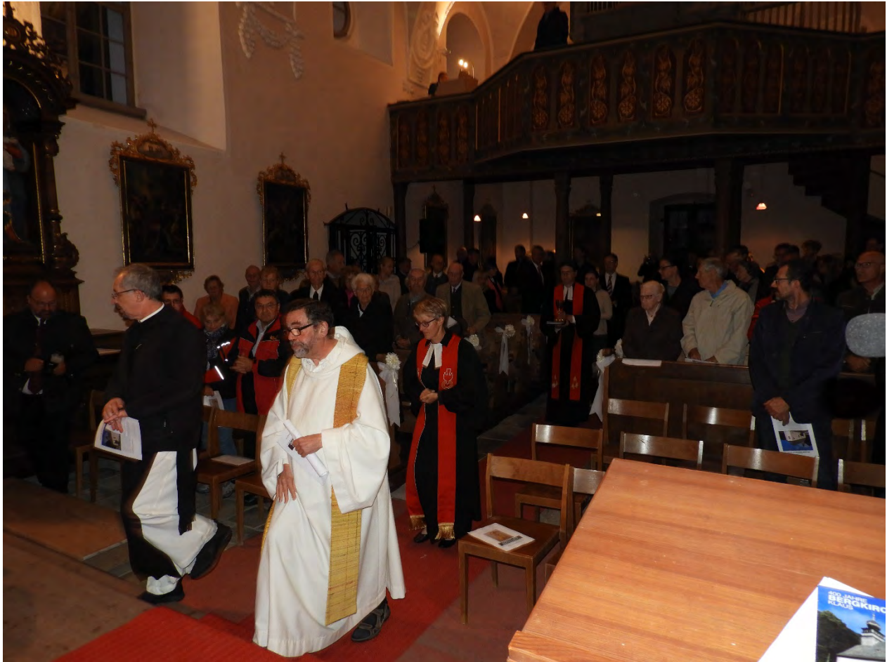
Einzug der Mitwirkenden und Festgäste aus Vach mit dem Abendmahlskelch