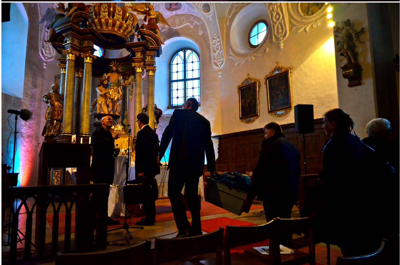
Letzte Vorbereitungen und Absprachen für den ökumenischen Gottesdienst mit Abendmahl