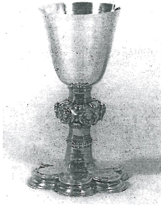
Abbildung: Abendmahlskelch, gestiftet von der Familie Storch von Claus 14

Eine bewegte und bewegende Geschichte eines Kelches und einer Familie!